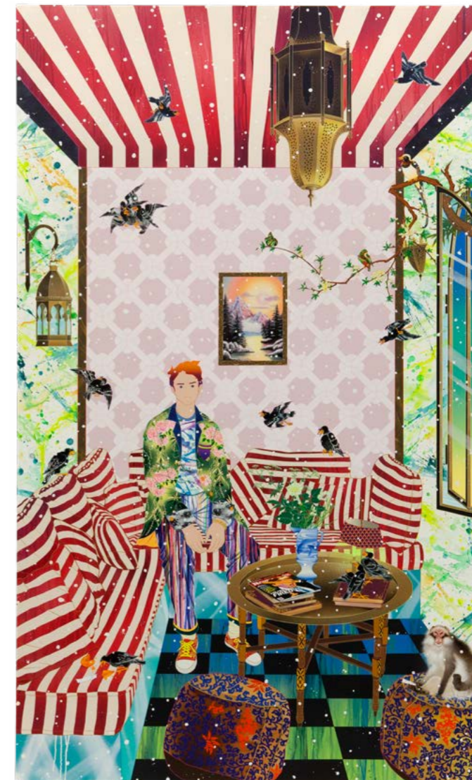
Tomokazu Matsuyama Broken train pick me , 2020 Olie op doek, 254 × 150 cm

Bij Tomokazu Matsuyama wordt het interieur een theatrale kruising van culturen en stijlen. Zijn schilderijen tonen huiselijke ruimtes die overlopen van patronen, kleuren en verwijzingen naar verschillende tijden en tradities. Ornamenten en decoratieve motieven versmelten tot een dynamische, collageachtige omgeving. Het interieur weerspiegelt geen stilte, maar een wereld in beweging, gevormd door globalisering en hybride identiteiten. Een spiegel van een complexe, geglobaliseerde werkelijkheid, waarin oosterse en westerse beeldtradities in elkaar overlopen. matzu.net