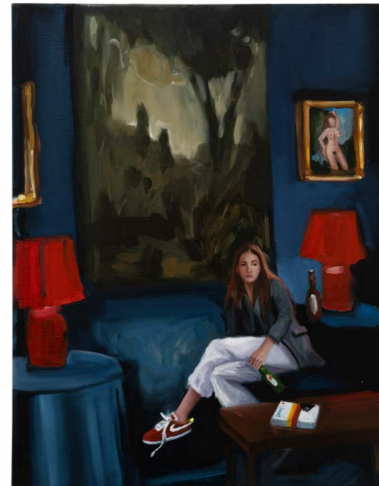
Karyn Lyons Evening interior , 2023 Olie op doek, 45 x 35 cm Courtesy: Stems Gallery