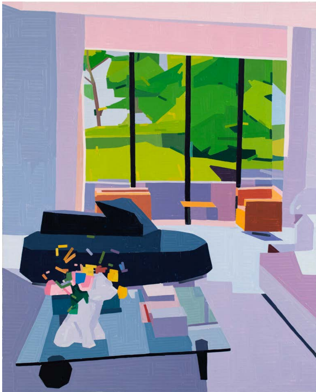
Guy Yanai Manon's salon , 2021 Olie op doek, 157 x 127 cm

tekst en productie YVETTE VAN CALDENBORGH en INGRID ADVANEY