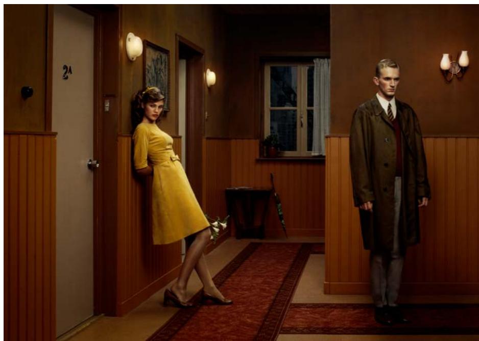
Erwin Olaf Hope, the hallway , 2005 Chromogene print, face-mounted op plexiglas, 70 x 98 cm