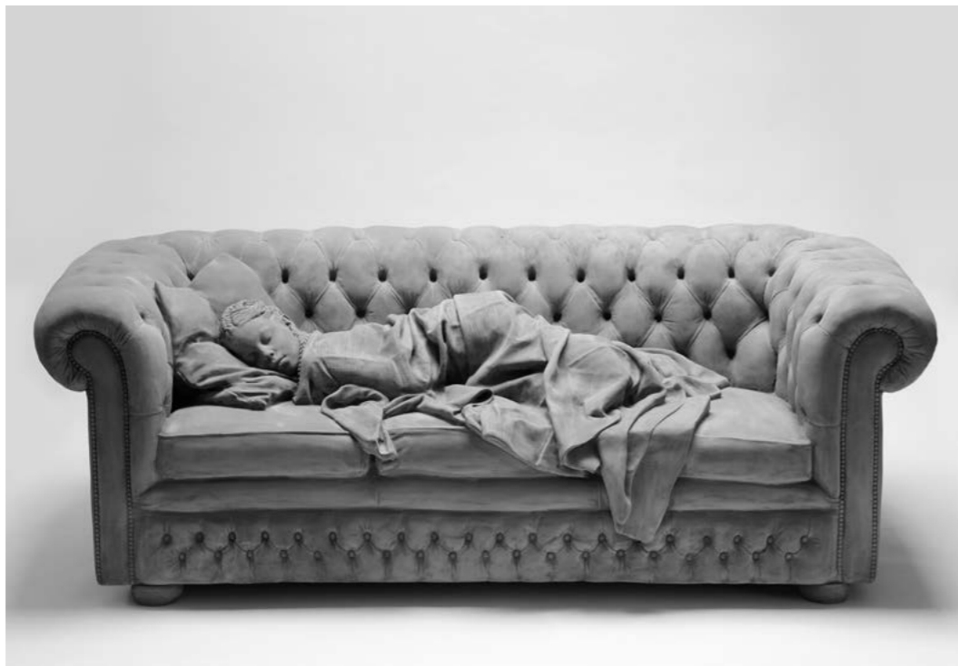
Hans Op de Beeck Sleeping girl , 2017 Polyester, aluminium, coating, 210 × 100 × 76 cm.