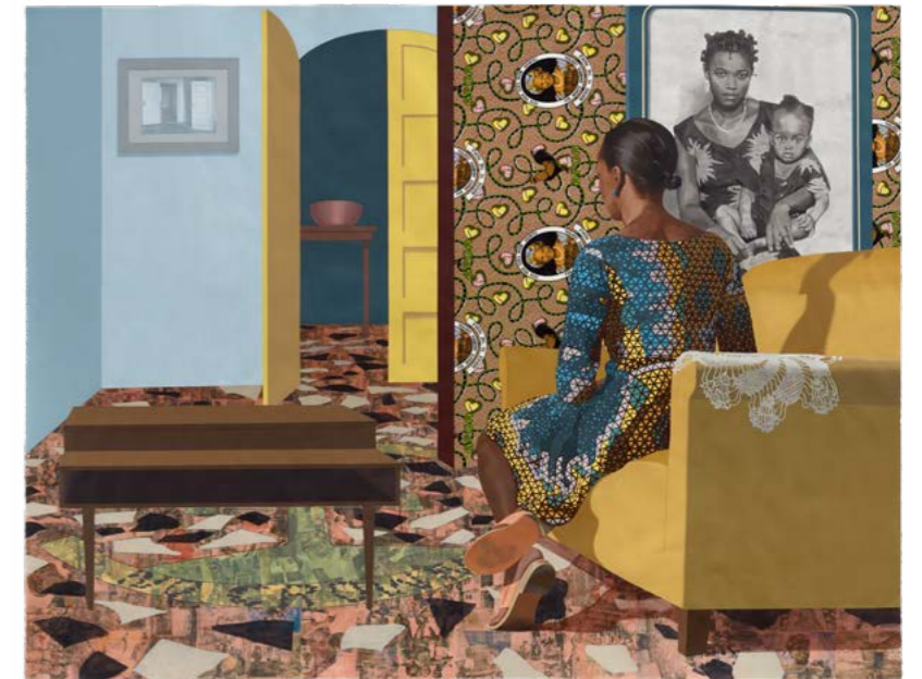
Njideka Akunyili Crosby Mother and child , 2016 Acryl, transfers, kleurpotlood, collage en herdenkingsstof op papier, 243 x 315 cm Courtesy: de kunstenaar, Victoria Miro en David Zwirner

Persoonlijke geschiedenis, culturele identiteit en herinnering komen samen in het werk van Njideka Akunyili Crosby. Ze komt uit een Nigeriaanse familie maar is opgeleid in de VS en verbindt zodoende verschillende werelden in haar schilderijen. Haar huiselijke interieurs zijn sterk autobiografisch: in een collage-achtige stijl combineert ze schilderkunst met familiefoto's uit persoonlijke archieven en Nigeriaanse tijdschriften, verwerkt in behang en vloer. Door deze gelaagde techniek vervaagt de grens tussen heden en verleden en het interieur wordt zo een plek van onderhandeling tussen Nigeria en de Verenigde Staten, traditie en hedendaags leven. De woonkamer fungeert als drager van identiteit: rijk, gelaagd en intiem. njidekaakunyilicrosby.com